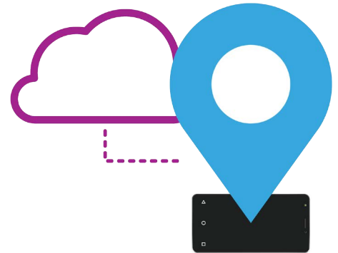
雲端服務可以協助找到丟失或被盜的裝置